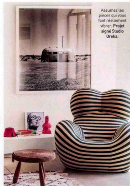
Assumez les pièces qui vous font réellement vibrer. Projet signé Studio Oreka.

« V oici deux points importants à prendre en considération lors de la conception de votre projet : son fonctionnement, son esthétique. Il n'y a aucun intérêt à vivre dans un endroit s'il n'est pas pratique au quotidien. » La styliste invite chacun à observer ce qui le rend heureux. À identifier les couleurs qui nous font sourire. « Lorsque vous regardez votre maison, quelles pièces aimez-vous ? Quand est-ce que vous vous sentiez vraiment en phase avec vous-même ? Passez du temps sur Pinterest et créez un dossier de vos looks préférés. Une fois que vous avez trouvé 20 photos que vous aimez, réduisez-les à vos 4 ou 5 préférées. » S'en dégage probablement un fil conducteur peut-être encore invisible à vos yeux. Charge à vous de le découvrir avant de vous lancer.