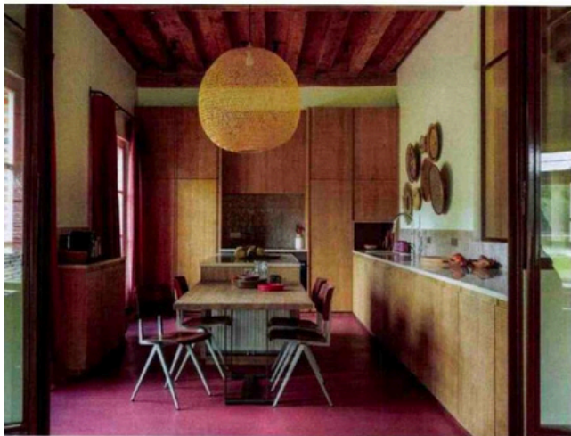
Un intérieur réussi est avant tout un intérieur pratique au quotidien. Ne sacrifiez pas donc cette dimension au seul profit du style sous peine de ne pas vous y sentir bien. Réalisation Santillane Design.