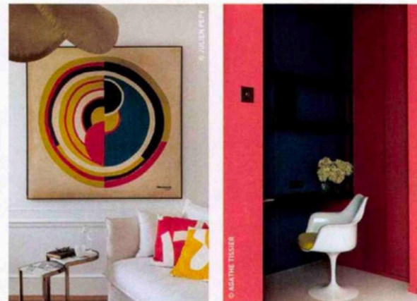
Votre décoration doit refléter ce qui vous rend heureux et non pas l'opinion des autres, rappelle l'auteur. N'hésitez pas à affirmer vos singularités. Réalisation MIID Interior Design.