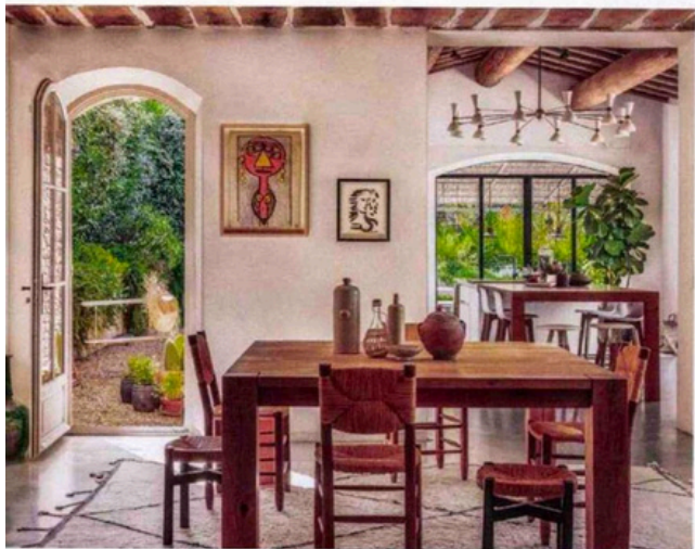
Regroupez les objets que vous avez accumulés au fil des années. Ils révèlent sans doute votre style déco. Servez-vous en comme fil conducteur. Projet signé Studio Oreka.