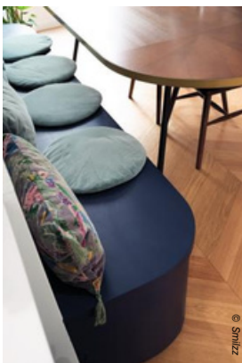
▲ Pour la rendre plus chaleureuse, on l'anime avec de généreux coussins. Projet Rome de Studio Castille.

Partout où sa présence se justifie. Voici le conseil donné par la jeune femme : « On y pense souvent dans la cuisine mais la banquette trouve sa place aussi dans l'entrée, dans un dressing ou même dans la salle de bains. La seule question à se poser concerne son utilité ! » Et c'est, de fait, souvent le cas puisqu'elle s'intègre facilement dans l'espace. « Sa présence règle certains problèmes de circulation. Elle optimise notamment le débattement des chaises dans une cuisine ou une salle à manger trop exigües, détaille la pro de l'aménagement. Elle offre une alternative dans la douche lorsque l'installation d'une baignoire s'avère impossible. Misez aussi sur son potentiel dans le dressing plutôt que sur une chaise qui finirait inévitablement en portemanteaux. » Parfois sa fonction n'est pas franchement indispensable mais sa présence est intéressante pour un rendu visuel plus fluide : « C'est le cas par exemple dans une entrée où l'œil porterait d'emblée sur une joue de dressing. Ici, utiliser la banquette en première hauteur visuelle permet de fluidifier l'espace et dégager la vue. »